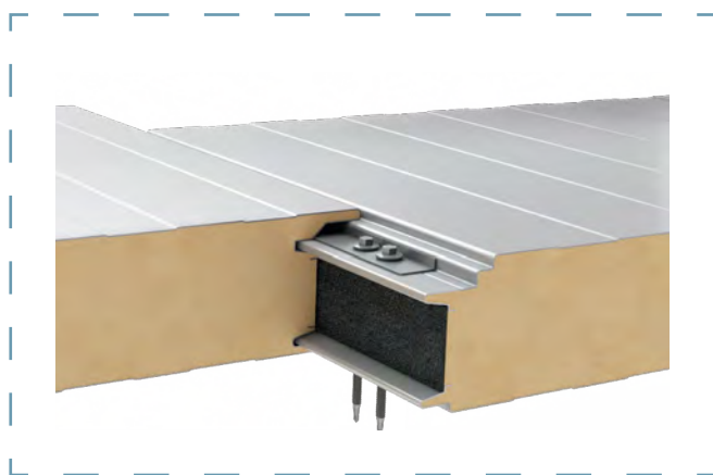
Schemat łączenia płyt